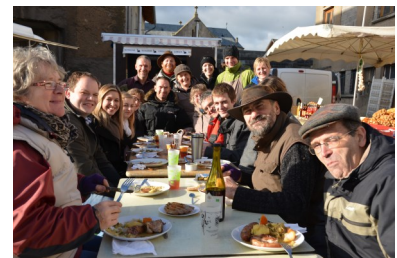
Table des producteurs lors du marché paysan de novembre à la Ferme du Fol'Epi